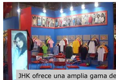
JHK ofrece una amplia gama de productos para satisfacer todos los mercados.

Todo el proceso de negociación con proveedores y clientes debía estar claramente establecido para garantizar el éxito comercial que se quería alcanzar.