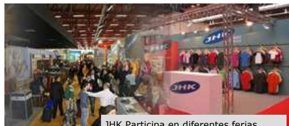
JHK Participa en diferentes ferias nacionales e internacionales

También, teniendo en cuenta su modelo de enfoque hacia la utilización masiva de sus prendas como medio publicitario, la segunda empresa del grupo Shirts and Stickers, se encarga de personalizar las prendas con logos e imágenes, bien sea bordadas o pegadas, para diferentes campañas de Marketing.